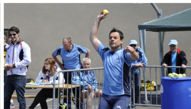
Zielwurf mit Tennisball